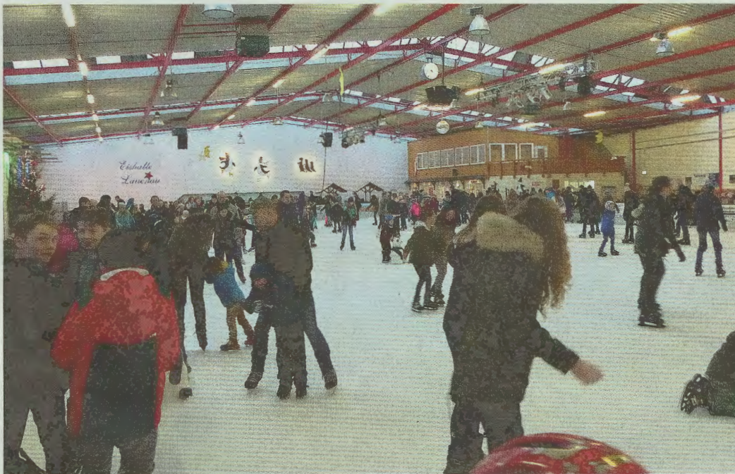
Gehört in den Wintermonaten zu den Besuchermagneten in der Region: die Eishalle Lauenau. FOTO: NAH

Die Öffnungszeiten haben sich geringfügig zugunsten des Eisstockschießens geändert. Montags bis donnerstags ist die Eishalle von 15 bis 19 Uhr geöffnet, freitags von 15 bis 20 Uhr, sonnabends von 10 bis 20 Uhr, sonntags von 11