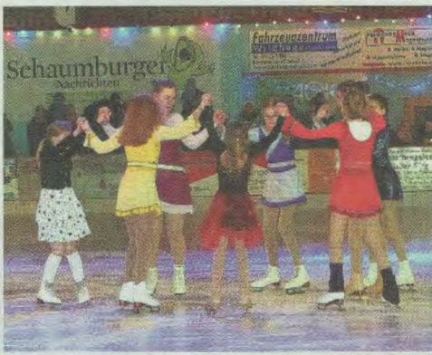
Zum Saisonauftakt wird den Besuchern traditionell eine unterhaltsame Eisrevue geboten.